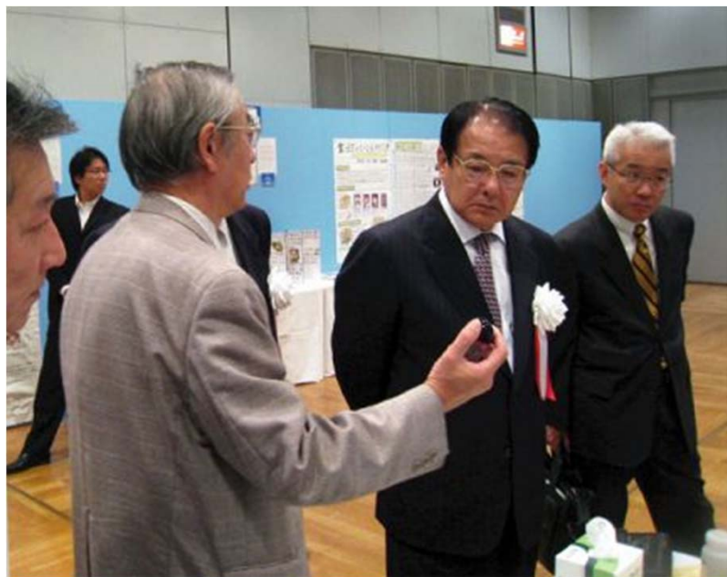
(上)麻生福岡県知事と、(右)磁気浮上実験

2008年からフクオカサイエンスマンスに 응용物理学会九州支部と共催で参加し、超伝導体を使った実験を実施