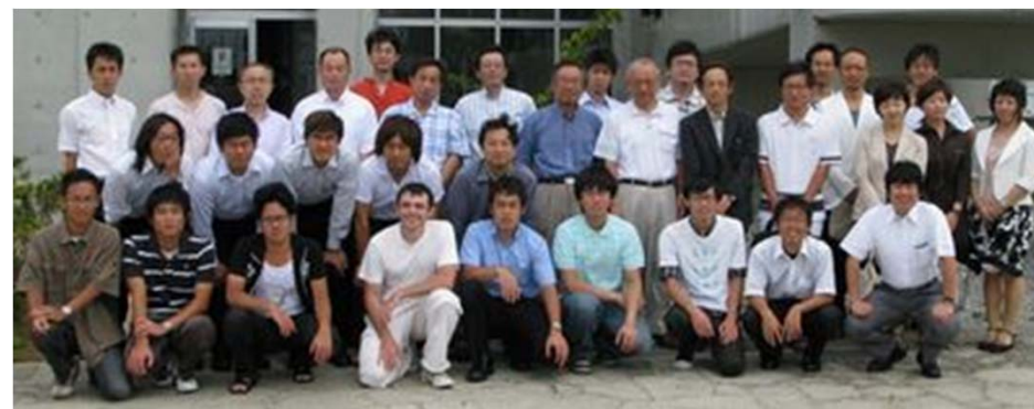
石垣市での超電導ワークショップ(2007)