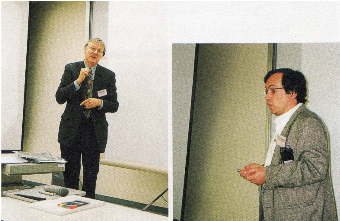
講演するEvetts教授 (左: Cambridge大学) とGurevitch博士(右: Wisconsin大学)

(The International Workshop on Critical Currents and Applications of HTS, Fukuoka, Oct. 2000)