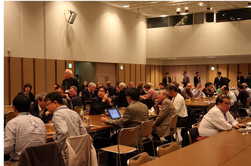
Rump Session の様子