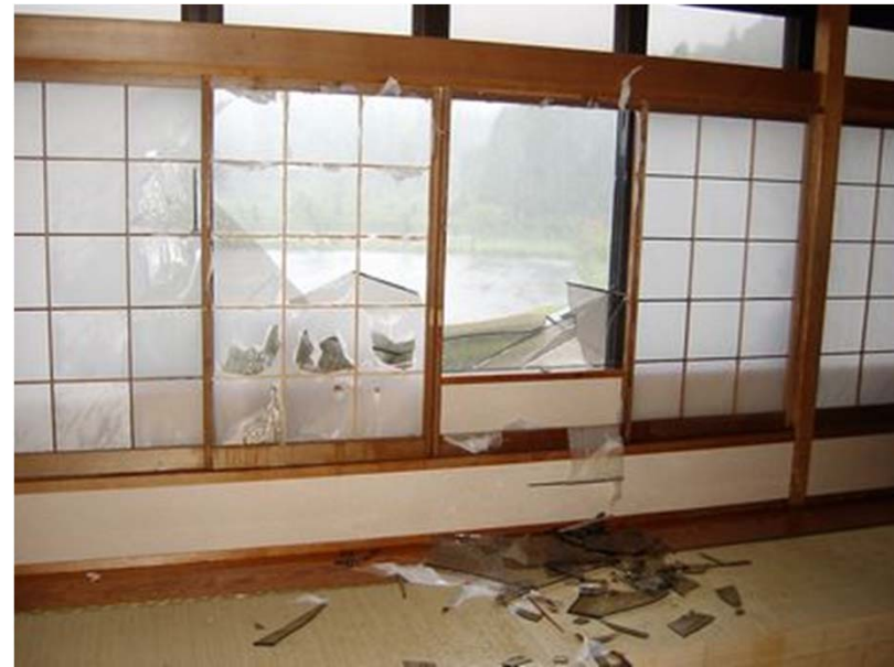
風圧で割れた窓ガラス