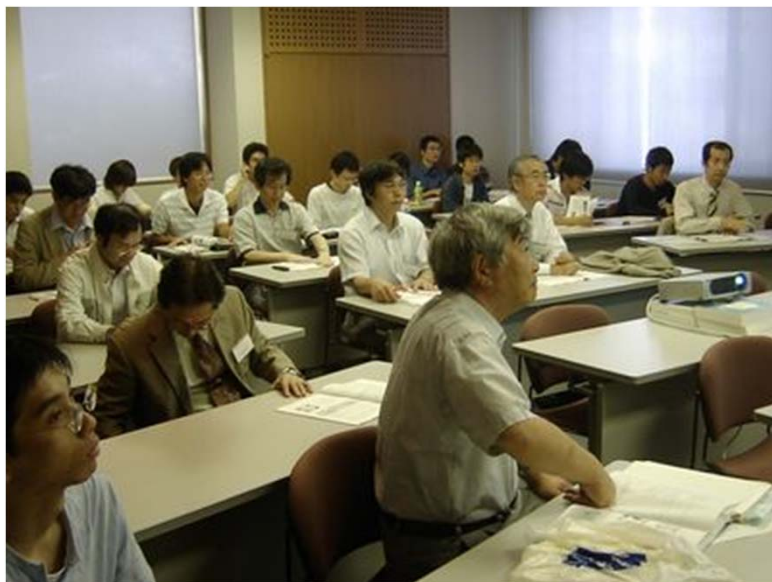
徳島大学での若手セミナー(2006)